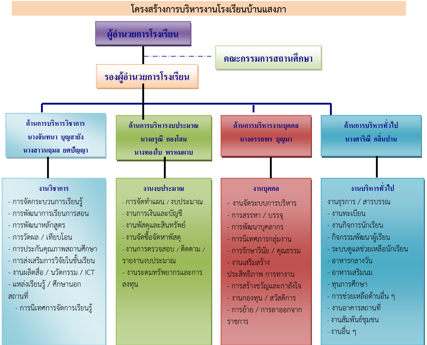
แผนภาพที่ ๑ โครงสร้างการบริหารงานโรงเรียน

โรงเรียนบ้านแสงภา แบ่งโครงสร้างการบริหารงานเป็น ๔ ด้าน ได้แก่ด้าน ด้านบริหารวิชาการ ด้านบริหารงบประมาณ ด้านบริหารงานบุคคล และด้านบริหารทั่วไปผู้บริหารยึดหลักการบริหาร PDCA